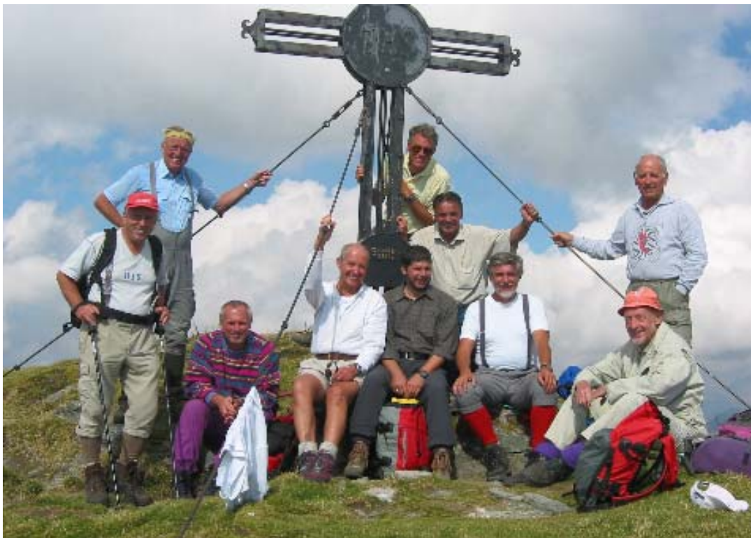
Am Geisstein, 2366 m, dem Jubiläumsberg der Dienstag-Riege